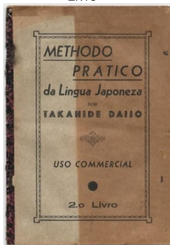
Figura 2 – Método prático da língua japonesa – 2º Livro