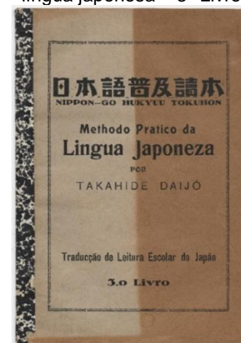
Figura 3 – Método prático da língua japonesa – 3º Livro